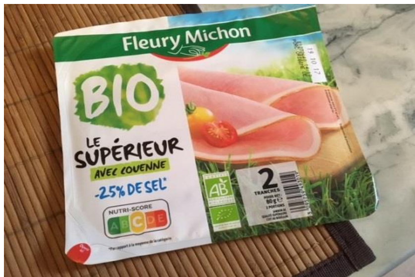
Nutriscore, une utilisation encore confidentielle.